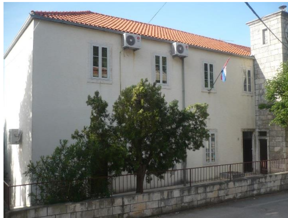
Područna škola Čara

Osnovna škola Smokvica i u školskoj 2022./2023. godini djeluje kao matična osnovna škola u Općini Smokvica. U svom sastavu ima Područnu školu u Čari.